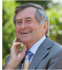
Alois Glück, ehemaliger Präsident des Bayerischen Landtags

Sammlung und Museum DASMAXIMUM sind von außergewöhnlicher Qualität und internationaler Bedeutung. Für unsere Region ist es eine einzigartige Chance, die Auseinandersetzung mit moderner Kunst direkt vor Ort zu führen. Künstlerinnen und Künstler haben einen besonderen Blick auf unsere Gegenwart, auf die Gesellschaft und existentielle Grundfragen. Sie nehmen die Wirklichkeit und Veränderungen in ihrer je eigenen Weise wahr und verdichten sie in ihren Werken. Deren Betrachtung kann uns irritieren, faszinieren, verstören und verzaubern. Sie kann uns herausfordern, unser Menschsein, Zusammenleben und unsere Traditionen aus einer neuen Perspektive in den Blick zu nehmen. Ich freue mich sehr, dass sich Bürger zu einem Freundes- und Förderkreis zusammengeschlossen haben, der dieses kulturelle Erlebnis in Traunreut und der Region verbreiten hilft.“