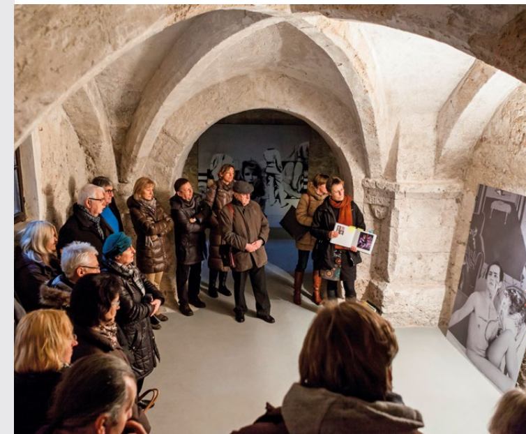
In den ältesten Gewölben der weltlängsten Burg: Besuch der Ausstellung „Heide Stolz“, 2013/14, in den Gewölben des Stadtmuseums Burghausen